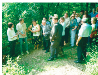
Sur le sentier André Beucler

Des expositions se préparent en Franche-Comté dans les bibliothèques et les librairies et l'ouverture officielle du sentier André Beucler , en mai 2006, créera un lieu de mémoire et d'animation, non loin de la maison familiale à Bondeval, dans le Doubs. Les élèves du lycée Viette y ont travaillé depuis le début de l'année.