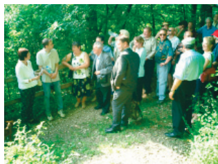
Sur le sentier André Beucler

Des expositions se préparent en Franche-Comté dans les bibliothèques et les librairies et l'ouverture officielle du sentier André Beucler , en mai 2006, créera un lieu de mémoire et d'animation, non loin de la maison familiale à Bondeval, dans le Doubs. Les élèves du lycée Viette y ont travaillé depuis le début de l'année.